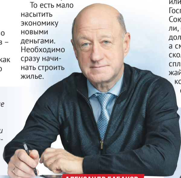
АЛЕКСАНДР БАБАКОВ

Это решит многие проблемы. А куда, например, пойдут пенсионные доходы пожилых россиян? Как правило, их детям, которые потратят эти суммы в первую очередь на покупку недвижимости. Так поступает примерно 70 % россиян, которые обладают хоть какими-то финансами. То есть мало насытить экономику новыми деньгами. Необходимо сразу начинать строить жилье.